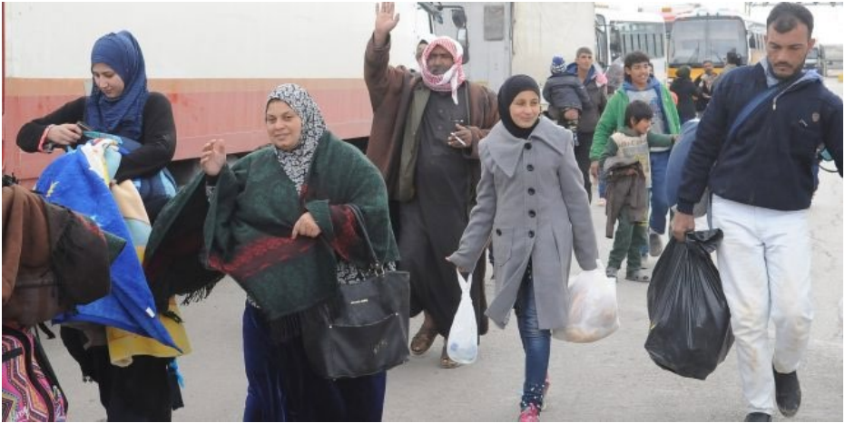
La población siria ya regresa a su casa desde los campos de refugiados. En la foto, vuelven a Siria desde Jordania (Agencia SANA, febrero 2019)

Muchos de los sirios que salieron de Siria no lo hicieron por una cuestión particular sino porque tenían combates a la puerta de casa, de manera que cuando desaparece esa situación, se quiere volver. Por tanto hay que precisar, hablamos de Refugiados o hablamos de emigrantes. Hay muchos sirios que están volviendo a Siria temporalmente, vuelven, están un mes o están dos meses, ven si pueden rehabilitar su casa y si pueden se quedan, o salen otra vez para volver con recursos y rehabilitar su casa. Es difícil cifrar esto.