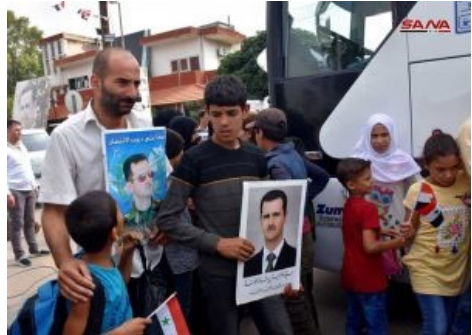
Sirios que regresaron a sus hogares desde Líbano el septiembre pasado

A estos emigrados que han vuelto, hay que sumar los muchos que han llegado por los tres aeropuertos internacionales abiertos de Qamishli, Latakia y especialmente de Damasco –hay un cuarto que está todavía cerrado-. El aeropuerto de Damasco ha estado intermitentemente cerrado, pero ahora está definitivamente abierto y tiene amplias conexiones, con Teherán, Ereván, Kuwait, Emiratos Árabes Unidos, Jartum, Bagdad, etc.